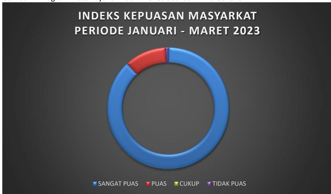
Gambar 1. Diagram Mutu Layanan Publik Periode Januari - Maret 2023